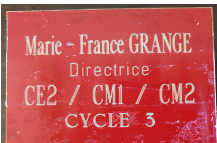
Plaque de porte retrouvée lors des travaux de réfection des écoles, et offerte à Mme Grange

Il est gratifiant de les voir s'épanouir, et progresser.